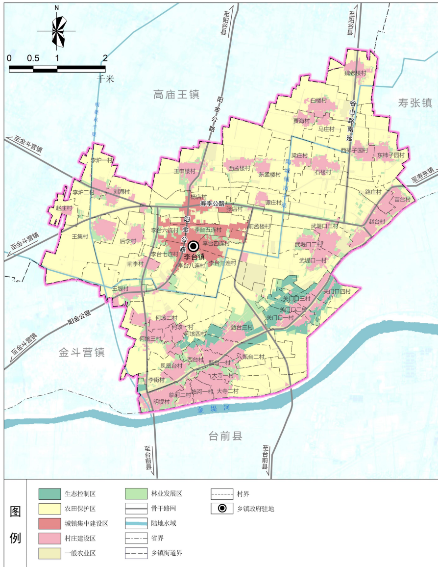
国土空间规划分区图

区、乡村发展区 5 个一级分区。将乡村发展区细化为村庄建设区、一般农业区和林业发展区 3 个二级分区。