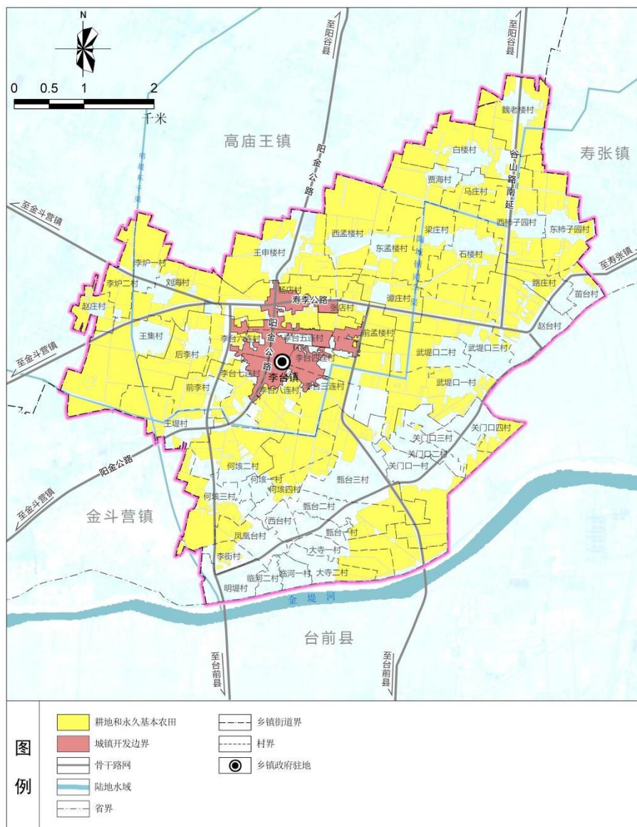
国土空间控制线规划图