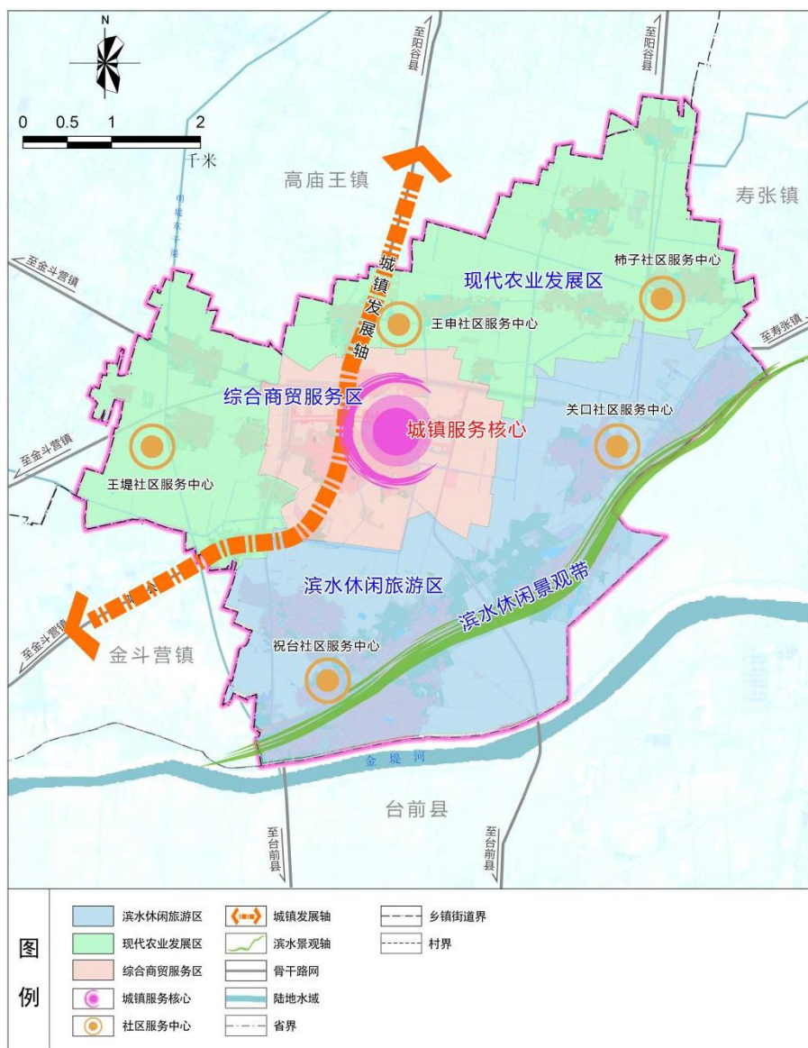
国土空间总体格局规划图